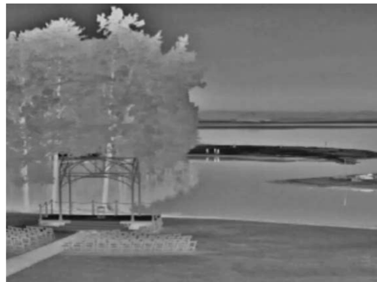
Vumii Sii ML 17um 640x480 w/ Continuous Zoom 15-100mm