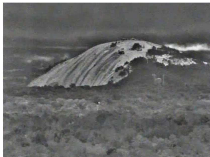
Vumii Accuracii XR 15um 640x512 15-300mm zoom 22km