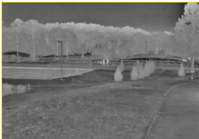
Sii AT 19mm