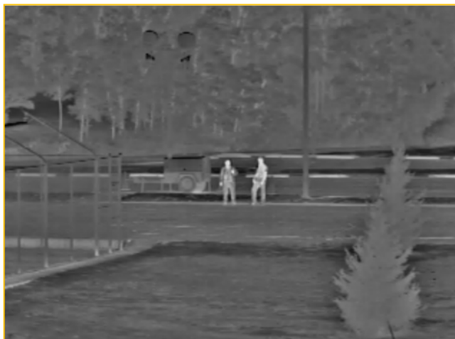
Sii ML DFOV @ 135mm