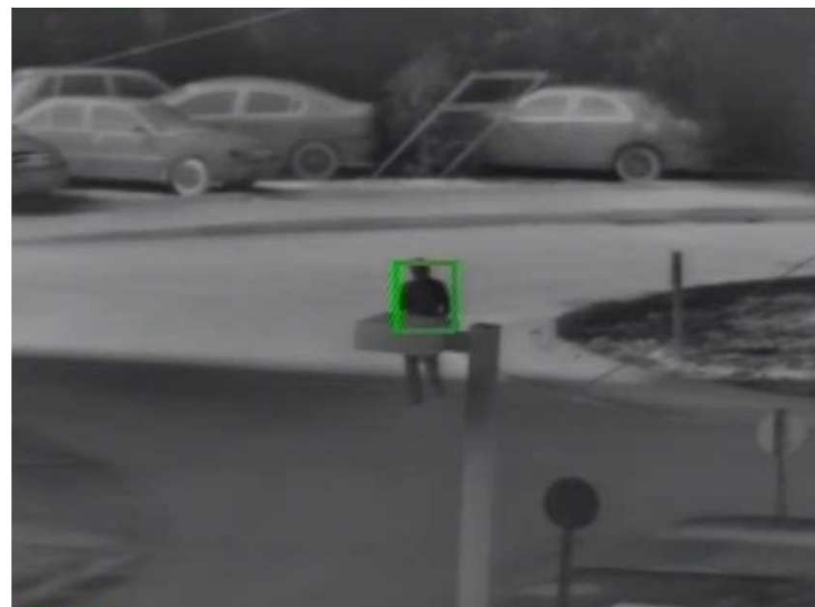
Vumii Sii AT with Tracking Analytics