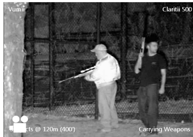
Vumii Claritii – Two subjects with weapons at 120m (400')