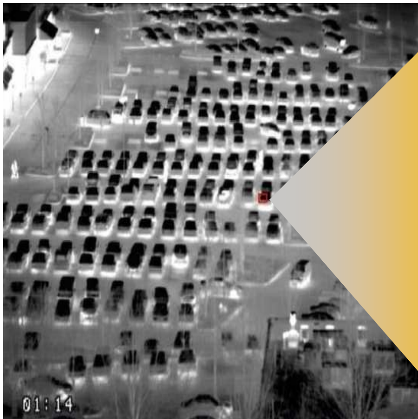
Using fixed FOV thermal imager