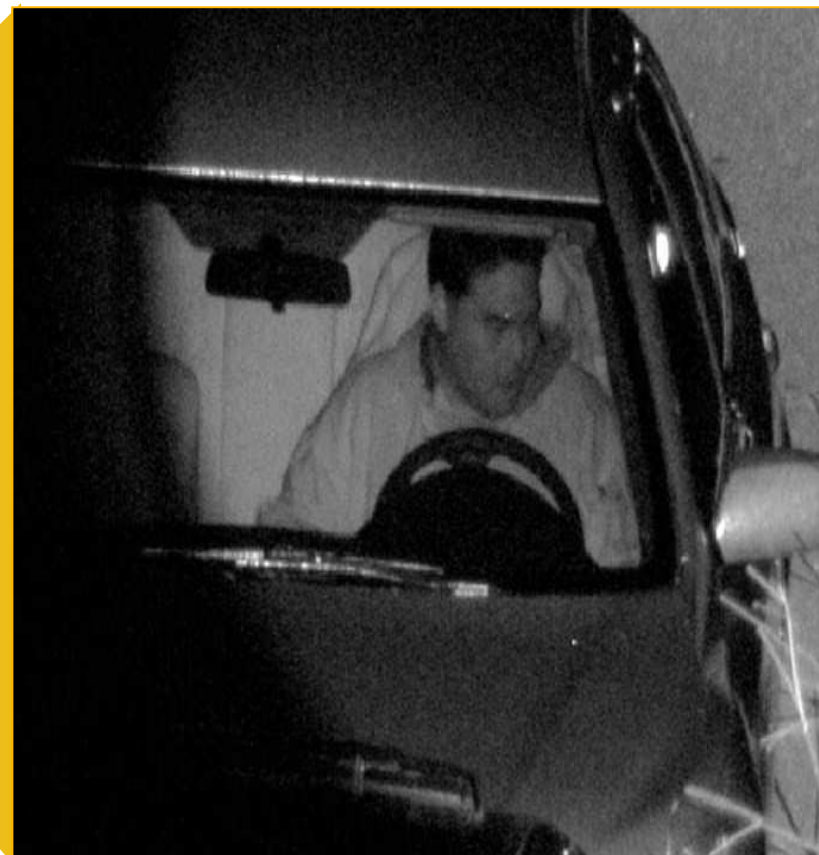
Using Vumii Discoverii 3000