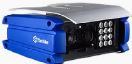
Vega Smart 2HD