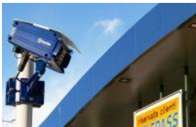
Sběr dopravních dat